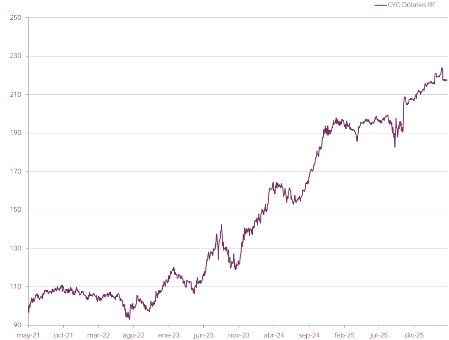
EVOLUCIÓN DE CUOTAPARTE DESDE INICIO